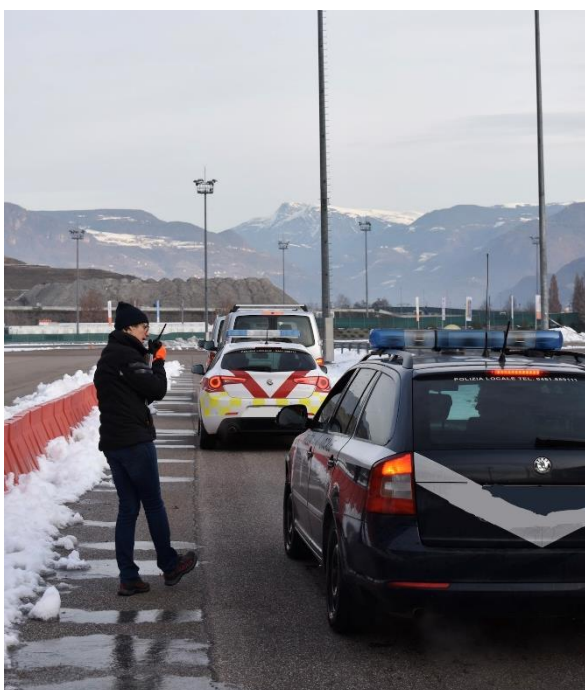
Foto 3: Corsi di guida sicura Ice&Fire