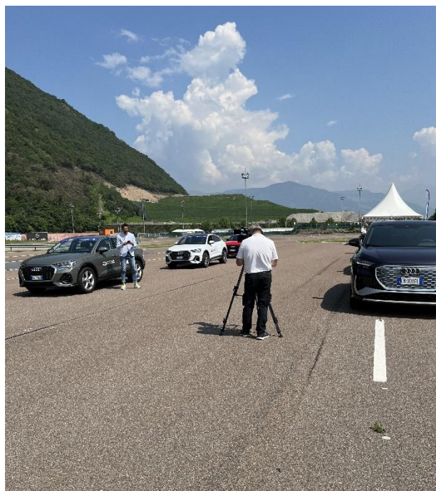
Foto 4: Evento Autodis Italia – Quattroruote