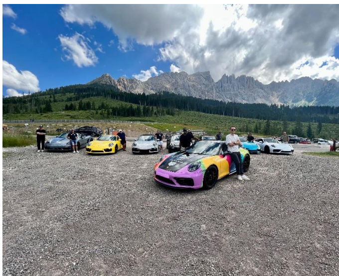
Foto 1: Porsche Zentrum Augusta