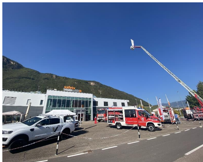
Foto 2: Evento Magirus Lohr – IVECO Group