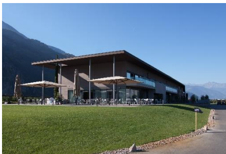
Bild 3: Das Sporthotel The Lodge in Eppan: Eines der hochmodernen Partnerhotels von Driving Experience Südtirol