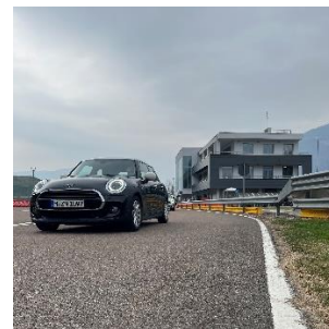
Bild 4: Einblick in die Fahraktivitäten der Driving Experience Südtirol im Safety Park Südtirol