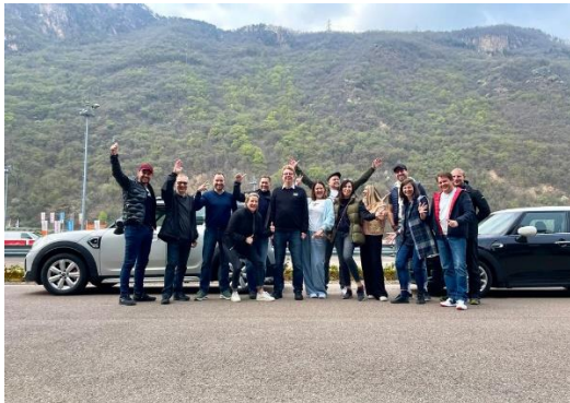
Bild 1: Die Teilnehmer des MICE-Workshops auf dem Gelände des Safety Park Südtirols