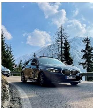
Bild 5: Die Mixed Flotte in Action auf dem Jaufenpass