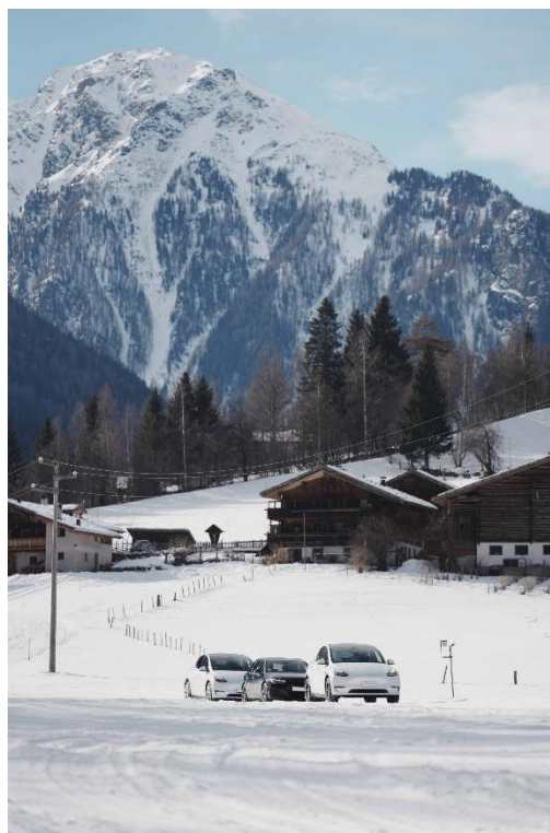
Bild 5: Winter Park in malerischer Umgebung