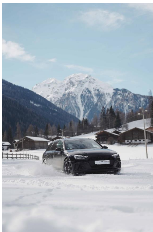
Bild 4: Fahrmanöver auf schneebedeckter Piste