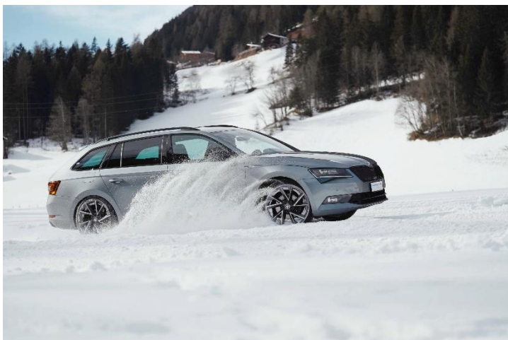
Bild 2: Drift Action im Winter Park