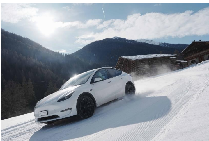
Bild 1: Testfahrt bei idealen Strecken- und Witterungsverhältnissen