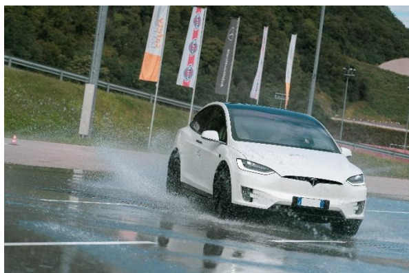
Immagine 1: corso di sicurezza veicoli elettrici