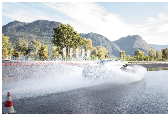
Immagine 2: controllo del veicolo su bagnato; corso di guida sicura