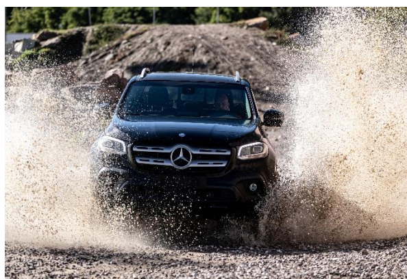
Immagine 5: Pura avventura nel parco offroad in Val Pusteria