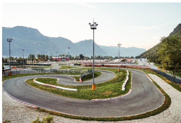
Immagine 3: nuove piste per diversi scenari di guida