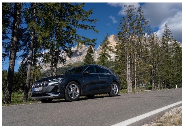
Immagine 4: tour spettacolari attraverso le montagne alto atesine