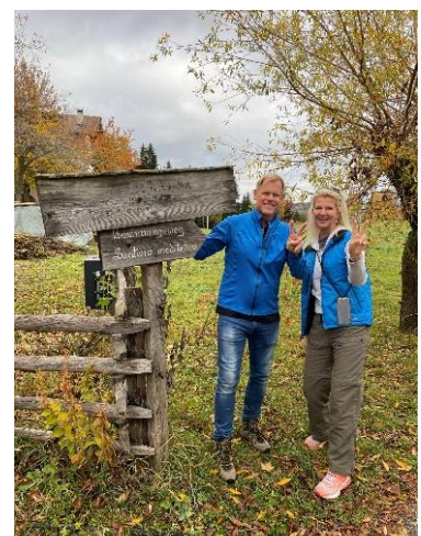
Bild 5: Die Südtiroler Kultur – die Teilnehmer auf dem „Bessinnungsweg“ Pensiero di Pellegrinaggio

Driving Experience Südtirol – eine Marke der CUBE brand communications GmbH