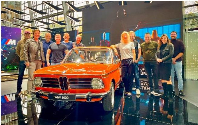
Bild 1: Von der BMW Welt München startete Driving Experience Südtirol den FAM-Trip mit brandneuen X5-Modellen