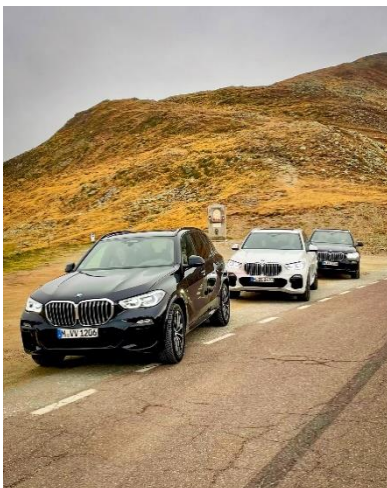
Bild 3: Die X5-Flotte in Action - bereitgestellt vom Kooperationspartner BMW rent (Quelle: Driving Experience Südtirol)