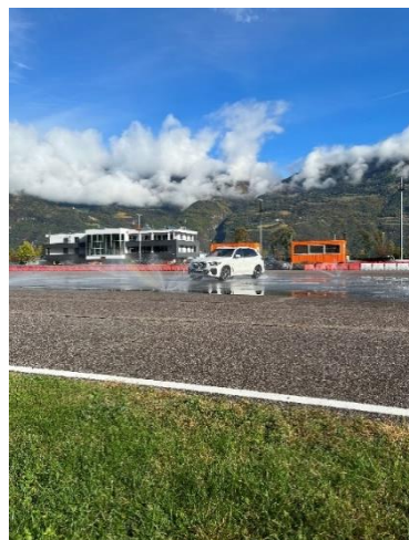
Bild 4: Einblick in die Fahraktivitäten der Driving Experience Südtirol im Safety Park Südtirol