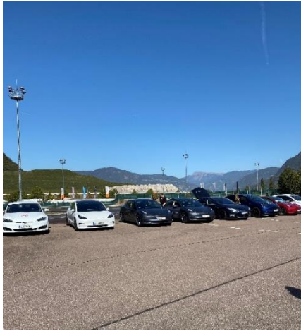
Bild 1: Der Tesla Club Austria zu Gast im Safety Park Südtirol