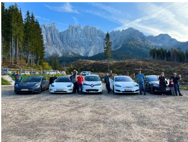
Bild 4: Die anschließende Ausfahrt – nach dem Training im Safety Park ging es direkt auf die Bergpässe Richtung Karer See