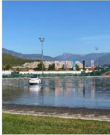
Bild 2: Ausschnitt aus dem Safety Drive - auf dem Driftzirkel wird das enge Umfahren von Kurven simuliert