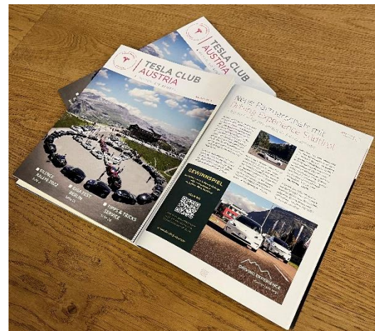
Bild 5: Partnerschaft zwischen Tesla Austria und DES - Auszug aus dem aktuellen Clubmagazin